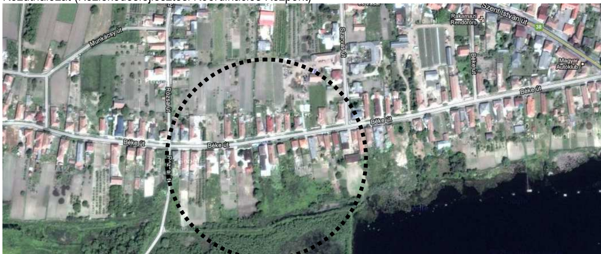
Átnézet térkép

Az önkormányzat településrendezési eszközök módosításával kívánja a település szabályozási előírásait pontosítani, beépíthetőségét javítani. Jelenlegi módosítások célja az Önkormányzati célú fejlesztési célú tevékenység kereteinek véglegesítése az érintett tömbökben, illetve a további fejlesztések építésügyi hatósági feltételeinek biztosítása, illetve fejlesztésekhez köthető pályázati szempontok érvényesítése. A településrendezési terv módosítás hatására, annak eredményeképpen a Város területének településszerkezete minimális mértékben változik, a vegyes területek mértéke nő, de a településszerkezet racionális és rendezett marad. Községi szempontból frekvenciált, kiépült infrastruktúrával rendelkező területeken kerül sor a módosításra.