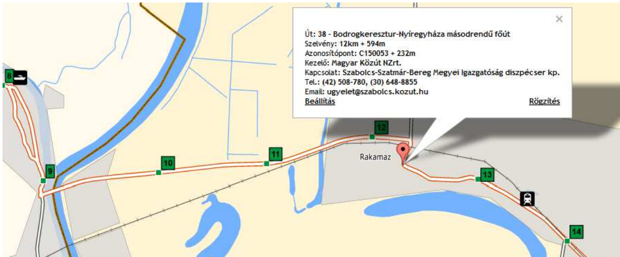
Közúthálózat (Közlekedésfejlesztési Koordinációs Központ)