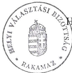
Smid-Balázs Beáta Helyi Választási Bizottság elnöke