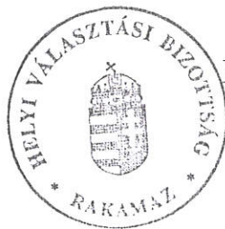
Smid-Balázs Beáta Helyi Választási Bizottság elnöke