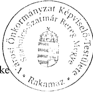
Fotta Csaba a bizottság elnöke